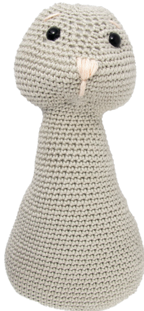
Haakpatroon Joep - 2 -